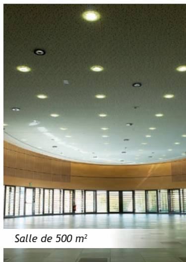
Salle de 500 m 2