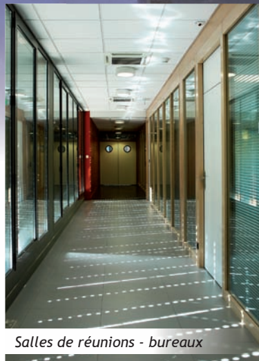
Salles de réunions - bureaux

Par ailleurs différentes techniques d'isolation contribuent à la bonne inertie de l'enveloppe du bâtiment (vitrages hautes performances, doubles parois en béton au rez-de-chaussée, structures à ossature bois de l'étage, toitures terrasses végétalisées, ventilation double flux pour un excellent confort thermique et une consommation d'énergie fortement réduite).