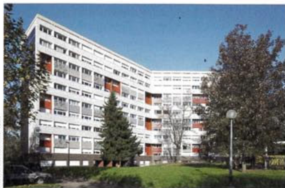
STEPHAN GRASCI / ARCHI+TECH

Le bâtiment avenue de Bourgogne a été primé au festival Fimbacte.